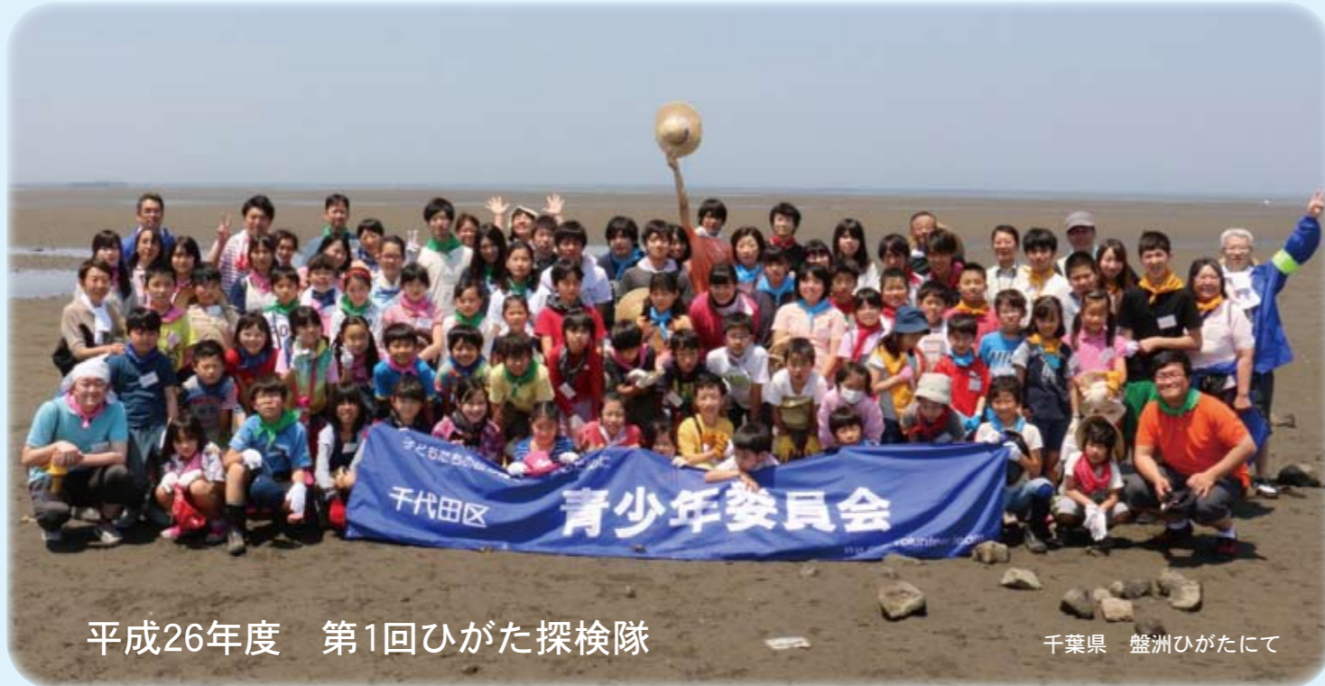
平成26年度 第1回ひがた探検隊