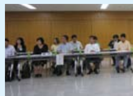
港区青少年委員会

今年度、初めての中央ブロック定例会が中央区にて開催されました。中央ブロックとは、港区・中央区・千代田区の三区で構成されています。今回は各区の新人委員紹介に始まり、各区の活動報告が映像を交えて行われ、それに関連した質疑応答も活発に行き交いました。それぞれの区が、昨年発足60周年を迎えた青少年委員会として過去を振り返り、新たな飛躍を目指して頑張っていこうとする姿が印象に残りました。