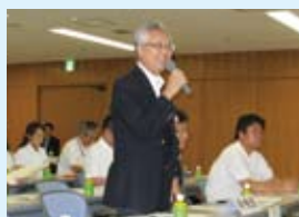
中央区青少年委員会

今年度、初めての中央ブロック定例会が中央区にて開催されました。中央ブロックとは、港区・中央区・千代田区の三区で構成されています。今回は各区の新人委員紹介に始まり、各区の活動報告が映像を交えて行われ、それに関連した質疑応答も活発に行き交いました。それぞれの区が、昨年発足60周年を迎えた青少年委員会として過去を振り返り、新たな飛躍を目指して頑張っていこうとする姿が印象に残りました。